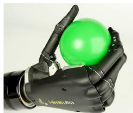
Brat Utah Arm 3 Plus, cupa protetica, mana bionica I-Limb Ultra Revolution